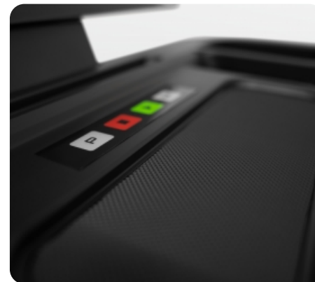
Консоль с клавишами быстрого доступа