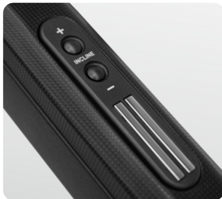
Регулировка наклона (0-12%)