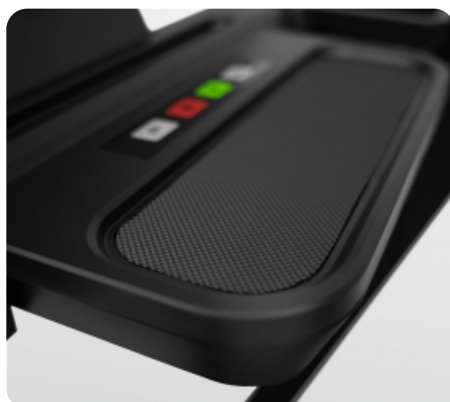
Удобный нескользящий коврик для личных вещей