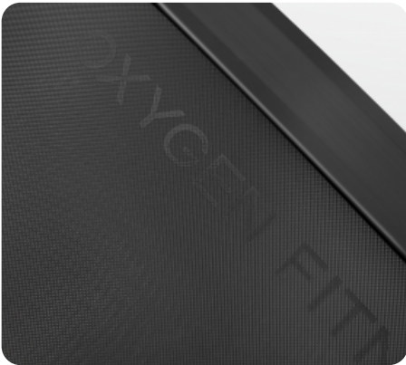
Многослойное антискользящее беговое полотно