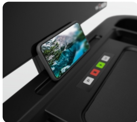
Подставка под мобильное устройство