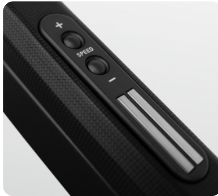
Удобные клавиши регулировки скорости на поручне