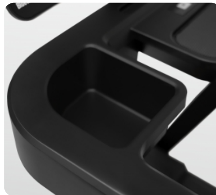
Дополнительный отсек для бутылки с водой