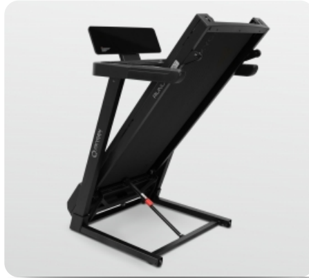
В сложенном виде