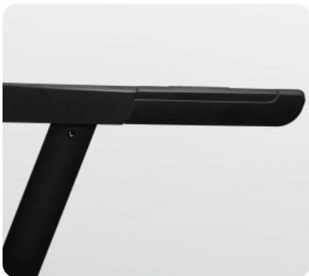
Удлиненные поручни для более безопасной тренировки