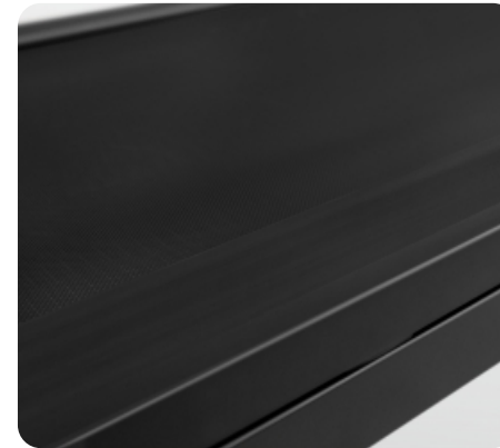
Антискользящие рифленые боковые направляющие